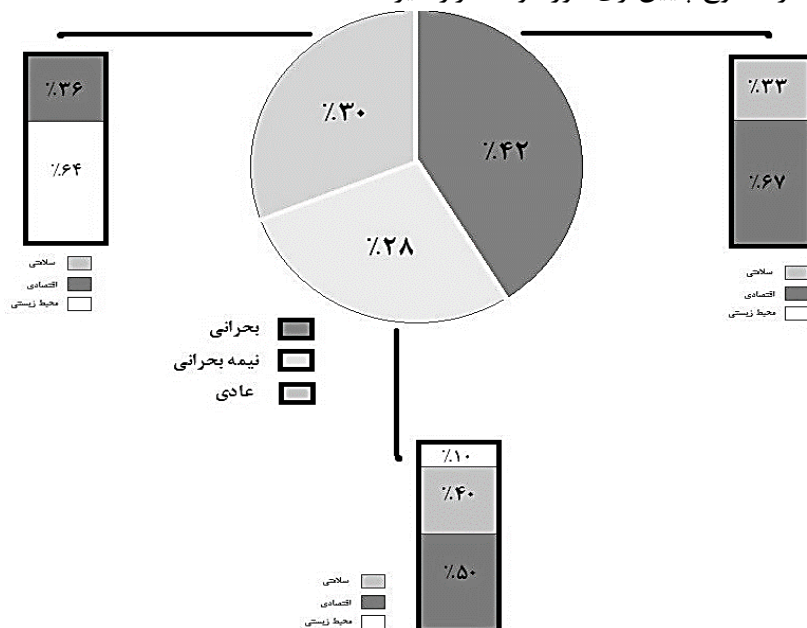
شکل (۲) نحوه توزیع ریسک‌ها در سطوح خطر و دسته‌بندی ریسک

بربخش محیط‌زیست می‌باشند. در ریسک‌های سطح عادی، ۶۴٪ از ریسک‌ها را ریسک‌های مؤثر بربخش محیط‌زیست تشکیل می‌دهند و ۳۶٪ از ریسک‌ها، ریسک‌های تأثیرگذار بر فعالیت‌های اقتصادی و مالی می‌باشند. وجود ریسک‌های بخش سلامت در رتبه‌بندی ریسک‌های بحرانی و نیمه بحرانی نشان‌دهنده اهمیت مبحث سلامت و تلاش در راستای کاهش تخلفات و خسارات جانی می‌باشد از طرفی عدم حضور ریسک‌های حوزه محیط‌زیست دربخش ریسک‌های بحرانی نشان‌دهنده این موضوع است که باوجود اهمیت بالای این حوزه و نیاز به توجه به مخاطرات آن در بحث شکست سد و پیامدهای ناشی از آن در سطوح اول اولویت قرار ندارد و لازم است در سطوح پایین‌تری موردتوجه قرار گیرد.