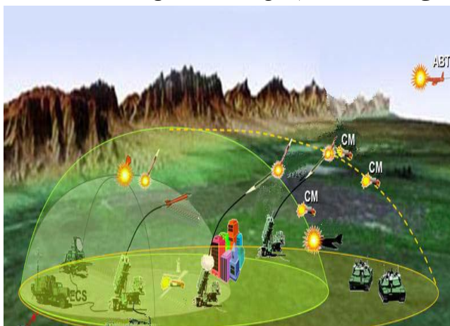
شکل ۲: گسترش سامانه سلاح دفاع هوایی چندلایه

به‌منظور مطالعه‌ی روش‌های تخصیص سلاح، چهار سامانه‌ی سلاح اصلی مد نظر قرار گرفته‌اند. (۴ و ۵) سامانه‌ی سلاح دفاع هوایی برد بلند، سامانه‌ی سلاح دفاع هوایی برد متوسط، سامانه‌ی سلاح دفاع هوایی برد کوتاه و یک سامانه‌ی لیزر که یک سپر دفاعی چندلایه را تشکیل می‌دهند. خصوصیات و توان‌مندی یک سامانه‌ی سلاح منفرد در مقابل موشک کروز، موشک بدون هدایت و هوایما، در جدول شماره ۱ درج شده است. تخصیص سلاح یکی از مسئولیت‌های اصلی سامانه‌ی فرماندهی و کنترل می‌باشد. همیشه این سؤال وجود دارد که چه ترکیبی از سلاح‌ها باید برای درگیر شدن با هدف مورد استفاده قرار گیرند. به‌منظور حداکثر نمودن قدرت نابودکنندگی در دفاع هوایی و با در نظر داشتن رعایت اصل صرفه‌جویی امکانات در هنگام دفاع، تخصیص سلاح ایده‌آل، یک ضرورت قطعی است.