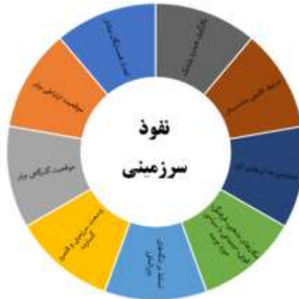
شکل (۱) الگوی نفوذ سرزمینی

۱۴۴۴ درصد)، دسترسی به آب‌های آزاد به میزان خیلی زیاد و زیاد (با فراوانی ۴۷ و ضریب ۹۲ درصد) و میزان تسلط بر تنگه‌های بین‌المللی به میزان خیلی زیاد (با فراوانی ۵۱ و ضریب ۱۰۰ درصد) بر ایجاد و توسعه نفوذ سرزمینی اثر دارند، بنابراین با اطمینان می‌توان گفت با برنامه‌ریزی صحیح و پرداختن به مولفه‌های یادشده، می‌توان به نفوذ سرزمینی دست یافت که بر اساس روابط یافت شده الگوی نفوذ سرزمینی به شرح ذیل (شکل ۱) ارائه می‌گردد: