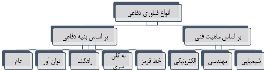
شکل (۱) تقسیم‌بندی انواع فناوری دفاعی