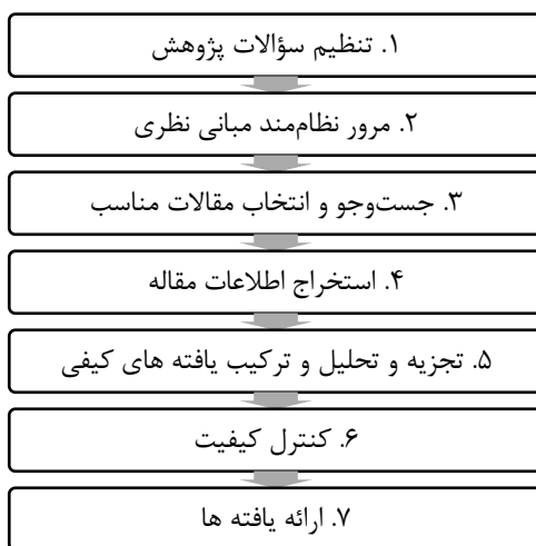
شکل (۲) مراحل فراترکیب

در فراترکیب از طریق ترکیب پژوهش‌های کیفی مختلف، به کشف موضوعات و استعاره‌های جدید و اساسی پرداخته می‌شود که در پی آن، دانش فعلی گسترش یافته و یک دید جامع نسبت به مسائل به وجود می‌آید (Zimmer, 2006). ساندلوسکی و باروسو، فرایند هفت مرحله‌ای را برای انجام فراترکیب معرفی کرده‌اند که در پژوهش حاضر نیز از این فرایند استفاده شده است (شکل ۲) (Sandelowski & Barroso, 2006)؛ بنابراین، محقق با بررسی پژوهش‌های حوزه تجاری‌سازی فناوری‌های دفاعی، به بررسی الزامات، چالش‌ها و روش‌های تجاری‌سازی فناوری‌های دفاعی پرداخته‌است.