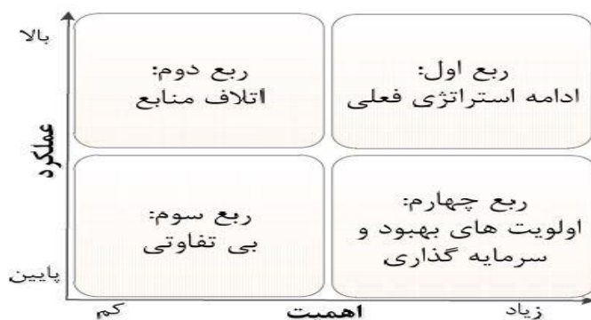
شکل (۱) ساختار ماتریس اهمیت-عملکرد

از آنجاکه تحلیل جداگانه داده‌های بعد عملکرد و بعد اهمیت، به‌ویژه زمانی که هر مجموعه داده‌ها، هم‌زمان مورد مطالعه قرار می‌گیرند ممکن است معنادار نباشد. لذا داده‌های مربوط به سطح اهمیت و عملکرد شاخص‌ها روی شبکه‌ای دوبعدی نمایش داده می‌شود. در این نمودار محور افقی نشانگر بعد اهمیت و محور عمودی نشانگر بعد عملکرد است. این شبکه دوبعدی ماتریس اهمیت-عملکرد ۲ نامیده می‌شود. ماتریس IPA در واقع از چهار قسمت یا ربع تشکیل شده و در هر ربع راهبرد خاصی قرار دارد. نقش این ماتریس کمک به فرآیند تصمیم‌گیری است. از این ماتریس برای شناخت درجه اولویت شاخص‌ها برای بهبود استفاده می‌شود.